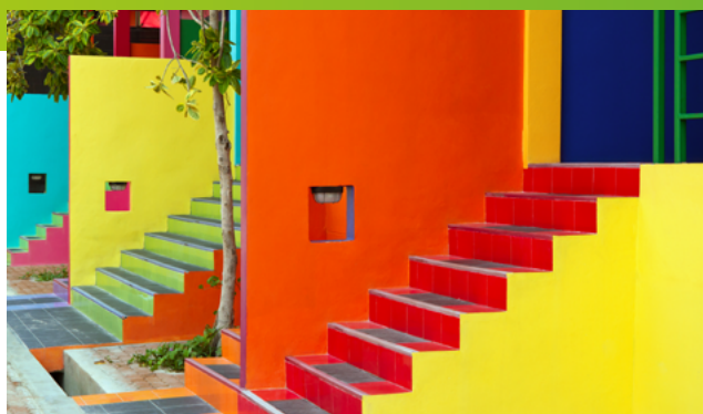
Immagini al solo scopo illustrativo